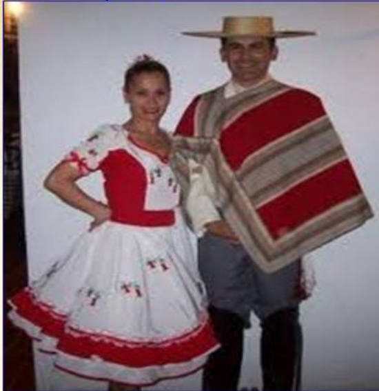
Traje típico chileno