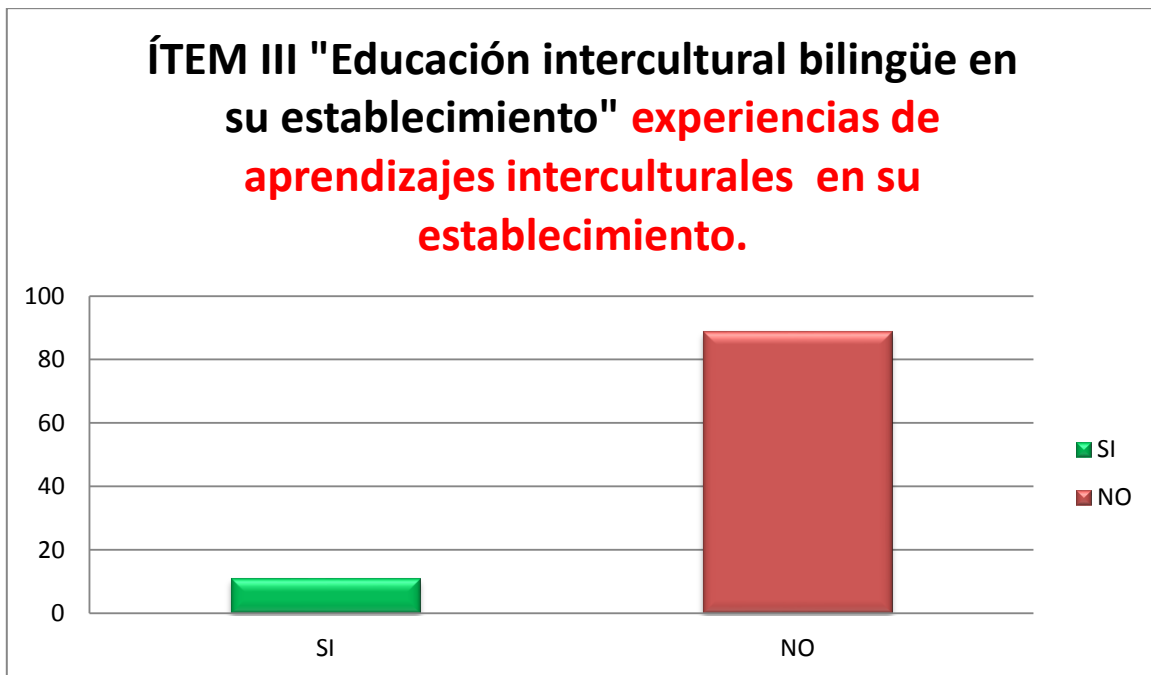
Análisis gráfico N° 3

Interpretando el gráfico número 3 sobre el ítem de educación intercultural bilingüe en su establecimiento , se observa que en el 85% de los establecimientos no se realizan experiencias interculturales dentro y fuera de aula.